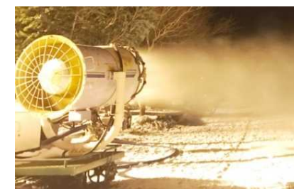
高機能な降雪機の導入により、営業期間を最大化・明確化