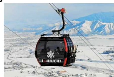
索道の再編や搬器の大型化・高速化により、混雑を改善し、快適性・満足度を向上