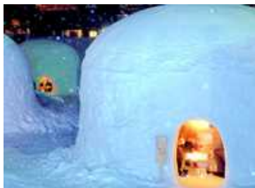
アフタースキーを楽しめる環境を整備し、外国人観光客の長期滞在を促進