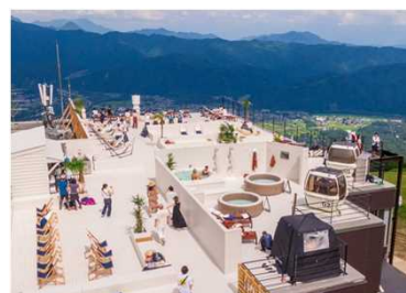
グリーンシーズンも楽しめる環境を整備し、通年での誘客を促進